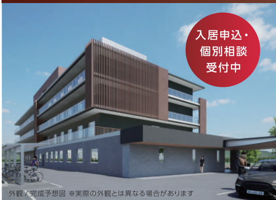
外観/完成予想図 ※実際の外観とは異なる場合があります